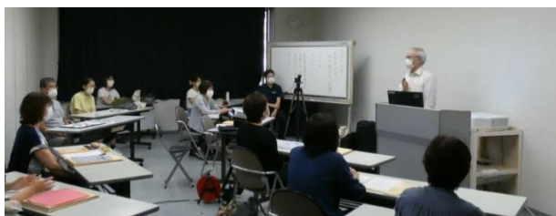
写真は要約筆記者養成講習会の開講式

今年は連日の酷暑。感染症対策でマスクを着用するうえ、窓を開けての換気で熱風が。室温も高めですが、受講生の皆さんは熱心に学んでいます。