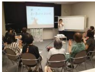
難聴者・中途失聴者を対象とした講座 「手話を学ぼう」 一緒に学びませんか？