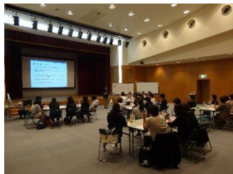
鹿児島県身体障害者福祉協会 登録手話通訳者研修会