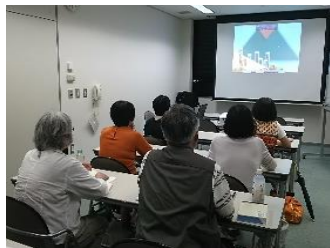
字幕ボランティア例会 字幕ボランティア講座