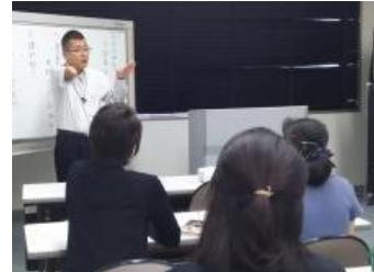
手話奉仕員養成講座 (基礎編)